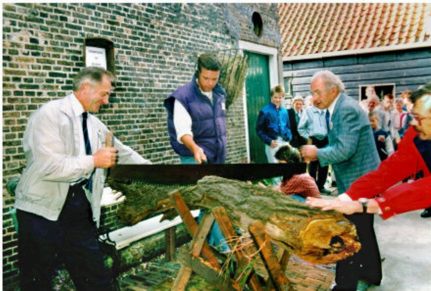
De bekende Oudheidkamer-openingsfoto van september 1992